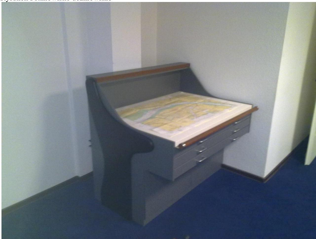
Rysunek I stanowisko uczniowskie